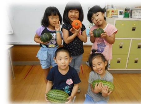
< さくら組 >

保育園の畑は子どもたちの願いが届いて大豊作です。毎日たくさん野菜を収穫し給食に調理して出させていただいています。自分たちが育てて収穫した野菜の味は格別!「おいしい」と、たくさんおわかりして食べています。採れたての野菜をその日に味わえるなんてとても幸せな経験だなと感じています。