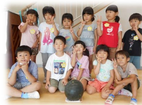
< きく組 >